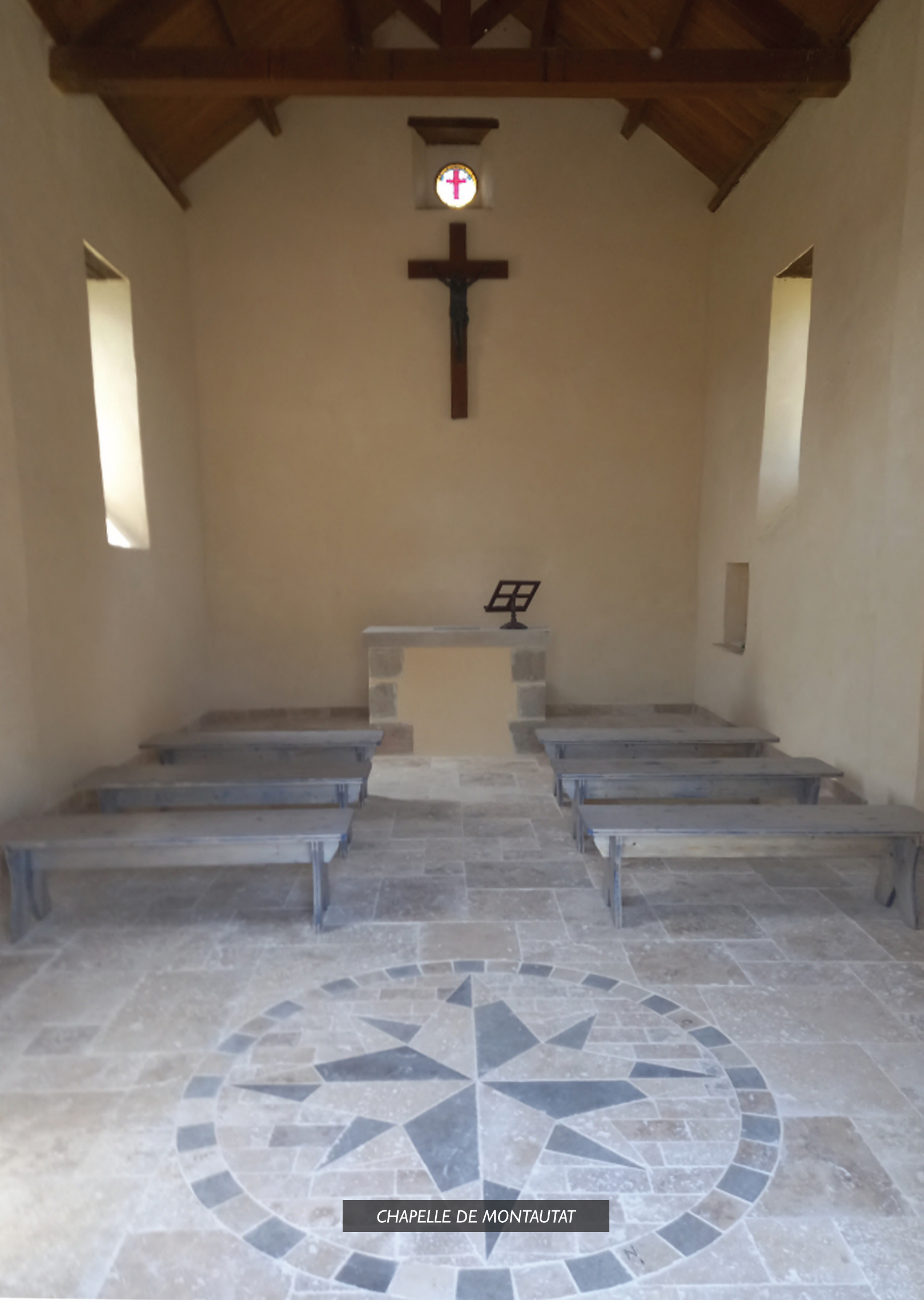
CHAPELLE DE MONTAUTAT